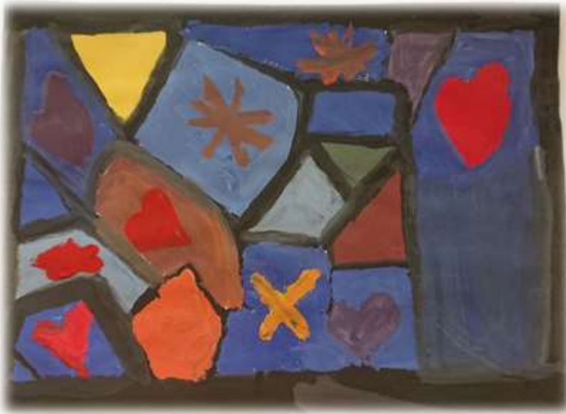
NAXIJE SHABANI 3. B